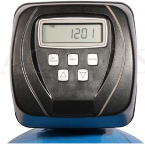
Abb. 2: Steuerventil Clack WS 1 TC

GFK- Druckflasche, gefüllt mit hochwertigem Ionenaustauscherharz, Kabinettgehäuse für einen Salzvorrat von max. 70kg, Zeitgesteuertes Zentralsteuerventil Typ Clack WS 1 TC, integriertes Feinverschneidungsventil, Absaugeinrichtung und Verbindungsleitung zum Zentralsteuerventil.