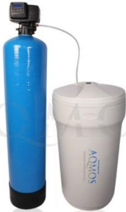
Abb. 1: Aqmos FMX-300