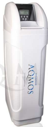
Abb. 1: Aqmos CM-40 Gegenstrombetrieb