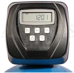
Abb. 2: Steuerventil Clack WS 1 CI

GFK- Druckflasche, gefüllt mit hochwertigem Ionenaustauscherharz, Kabinettgehäuse für einen Salzvorrat von max. 60kg, mengengesteuertes Zentralsteuerventil Typ Clack WS 1 CI, integriertes Feinverschneidungsventil, Absaugeinrichtung und Verbindungsleitung zum Zentralsteuerventil.