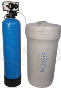
Abb. 1: Aqmos FSX-80