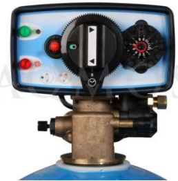
Abb. 2: Steuerventil Fleck 5600 time

GFK-Druckflasche, gefüllt mit hochwertigem Ionenaustauscherharz, PE-Solebehälter für einen Salzvorrat von max. 75kg, zeitgesteuertes Zentralsteuerventil Typ FLECK 5600 time, integriertes Feinverschneidungsventil, Absaugeinrichtung und Verbindungsleitung zum Zentralsteuerventil.