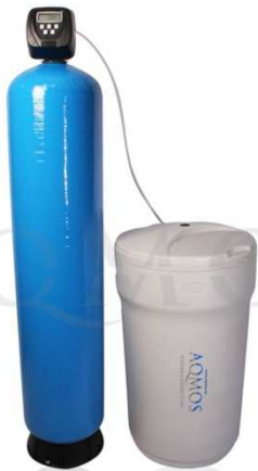
Abb. 1: Aqmos CMX-400 Gegenstrombetrieb