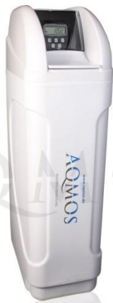
Abb. 1: Aqmos CS-60