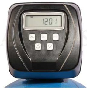
Abb. 2: Steuerventil Clack WS 1 CI

GFK- Druckflasche, gefüllt mit hochwertigem Ionenaustauscherharz, Kabinettgehäuse für einen Salzvorrat von max. 70kg, mengengesteuertes Zentralsteuerventil Typ Clack WS 1 CI, integriertes Feinverschneidungsventil, Absaugeinrichtung und Verbindungsleitung zum Zentralsteuerventil.