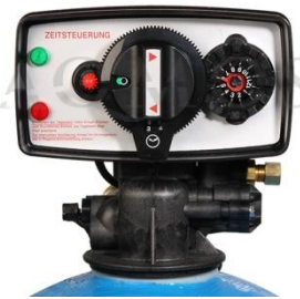
Abb. 2: Steuerventil Fleck 5600 time

GFK-Druckflasche, gefüllt mit hochwertigem Ionenaustauscherharz, Kabinettgehäuse für einen Salzvorrat von max. 20kg, Zeitgesteuertes Zentralsteuerventil Typ FLECK 5600 time, integriertes Feinverschneidungsventil, Absaugeinrichtung und Verbindungsleitung zum Zentralsteuerventil.