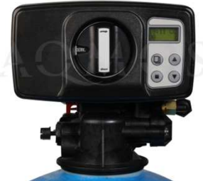
Abb. 2: Steuerventil BNT 1650

GFK- Druckflasche, gefüllt mit hochwertigem Ionenaustauscherharz, Kabinettgehäuse für einen Salzvorrat von max. 70 kg, abnehmbarer Deckel, mengengesteuertes Zentralsteuerventil Typ BNT 1650, integriertes Feinverschneidungsventil, Absaugeinrichtung und Verbindungsleitung zum Zentralsteuerventil.