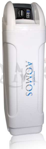
Abb. 1: Wasserenthärter BM-100