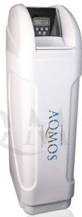
Abb. 1: Aqmos CM-60 Gegenstrombetrieb