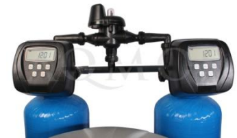
Abb. 2: 2x Steuerventil Clack WS 1 Cl mit Verrohrung und Motor

2x GFK- Druckflasche, gefüllt mit hochwertigem Ionenaustauscherharz, PE-Solebehälter für einen Salzvorrat von max. 120kg, 2x mengengesteuertes Zentralsteuerventil Typ Clack WS 1 mit Verrohrung (ein Steuerkopf pro GFK-Druckflasche), integriertes Feinverschneidungsventil, Absaugeinrichtung und Verbindungsleitung zum Zentralsteuerventil.