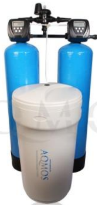
Abb. 1: Aqmos CMD2-240