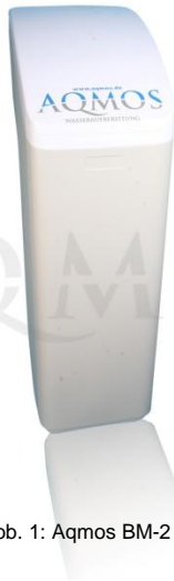
Abb. 1: Aqmos BM-2 CLOUD