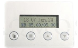
Abb. 2: Steuerventil BNT 85

GFK- Druckflasche, gefüllt mit hochwertigem Ionenaustauscherharz, modernes Design, Kabinettgehäuse für einen Salzvorrat von max. 43kg, aufklappbarer Deckel, mengengesteuertes Zentralsteuerventil Typ BNT 85, integriertes Feinverschneidungsventil, Absaugeinrichtung und Verbindungsleitung zum Zentralsteuerventil.