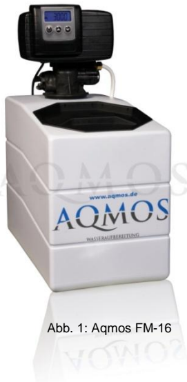
Abb. 1: Aqmos FM-16