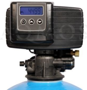
Abb. 2: Steuerventil Fleck 5600 SXT

GFK- Druckflasche, gefüllt mit hochwertigem Ionenaustauscherharz, Kabinettgehäuse für einen Salzvorrat von max. 20 kg, mengengesteuertes Zentralsteuerventil Typ FLECK 5600, integriertes Feinverschneidungsventil, Absaugeinrichtung und Verbindungsleitung zum Zentralsteuerventil.