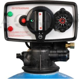
Abb. 2: Steuerventil Fleck 5600 time

GFK-Druckflasche, gefüllt mit hochwertigem Ionenaustauscherharz, Kabinettgehäuse für einen Salzvorrat von max. 60kg, abnehmbarer Deckel, Zeitgesteuertes Zentralsteuerventil Typ FLECK 5600 time, integriertes Feinverschneidungsventil, Absaugeinrichtung und Verbindungsleitung zum Zentralsteuerventil.