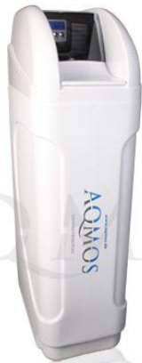
Abb. 1: Aqmos FM-40