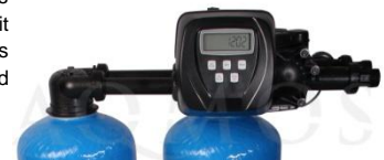
Abb. 2: 1x Steuerventil Clack WS 1 mit Verrohrung

2x GFK-Druckflasche, gefüllt mit hochwertigem Ionenaustauscherharz, PE-Solebehälter für einen Salzvorrat von max. 75kg, mengengesteuertes Zentralsteuerventil Typ Clack WS 1 mit Verrohrung (ein Steuerkopf), integriertes Feinverschneidungsventil, Absaugeinrichtung und Verbindungsleitung zum Zentralsteuerventil.