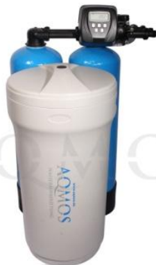
Abb. 1: Aqmos CMD1-100