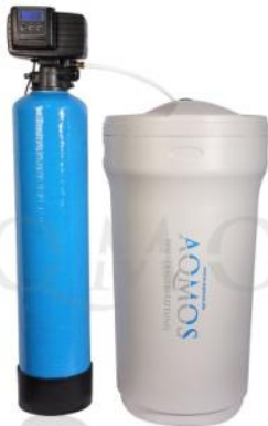
Abb. 1: Aqmos FMX-60