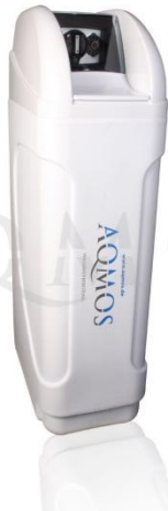
Abb. 1: Aqmos FS-120