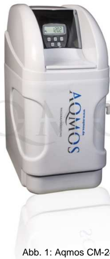
Abb. 1: Aqmos CM-24 Gegenstrombetrieb