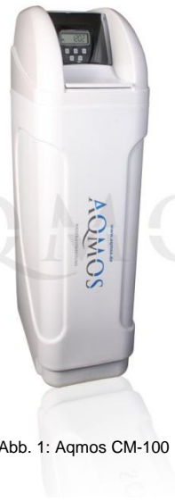
Abb. 1: Aqmos CM-100