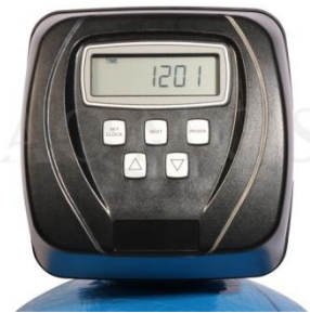
Abb. 2: Steuerventil Clack WS 1 CI

GFK- Druckflasche, gefüllt mit hochwertigem Ionenaustauscherharz, Kabinettgehäuse für einen Salzvorrat von max. 70kg, mengengesteuertes Zentralsteuerventil Typ Clack WS 1 CI, integriertes Feinverschneidungsventil, Absaugeinrichtung und Verbindungsleitung zum Zentralsteuerventil.