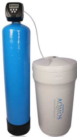
Abb. 1: Aqmos CMX-200 Gegenstrombetrieb