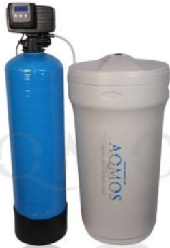
Abb. 1: Aqmos FMX-120