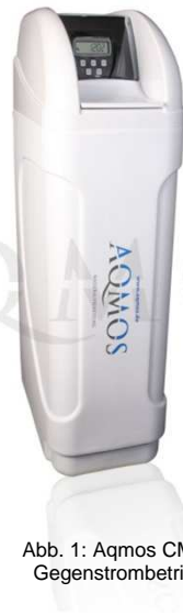
Abb. 1: Aqmos CM-80 Gegenstrombetrieb