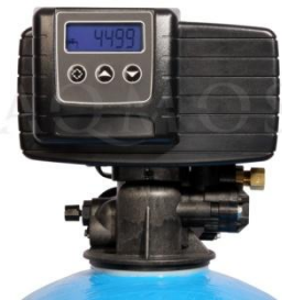
Abb. 2: Steuerkopf Fleck 5600 SXT

GFK- Druckflasche, gefüllt mit hochwertigem Ionenaustauscherharz, PE- Solebehälter für einen Salzvorrat von max. 75 kg, mengengesteuertes Zentralsteuerventil Typ FLECK 5600, integriertes Feinverschneidungsventil, Absaugeinrichtung und Verbindungsleitung zum Zentralsteuerventil.