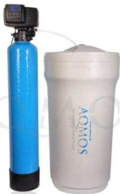
Abb. 1: Aqmos FMX-40