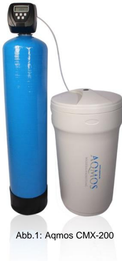
Abb. 1: Aqmos CMX-200