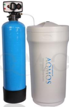
Abb. 1: Aqmos FSX-120