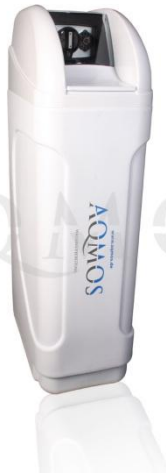
Abb. 1: Aqmos FS-60