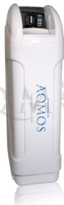
Abb. 1: Aqmos BM-120