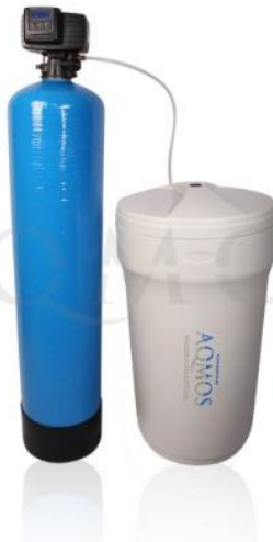
Abb. 1: Aqmos FMX-240