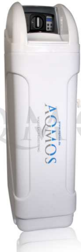
Abb. 1: Aqmos BM-40