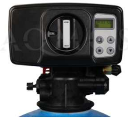
Abb. 2: Steuerventil BNT 1650

GFK- Druckflasche, gefüllt mit hochwertigem Ionenaustauscherharz, Kabinettgehäuse für einen Salzvorrat von max. 60 kg, abnehmbare Deckel, mengengesteuertes Zentralsteuerventil Typ BNT 1650, integriertes Feinverschneidungsventil, Absaugeinrichtung und Verbindungsleitung zum Zentralsteuerventil.