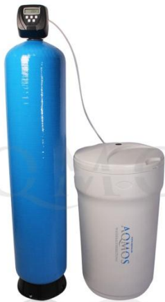
Abb. 1: Aqmos CMX-400